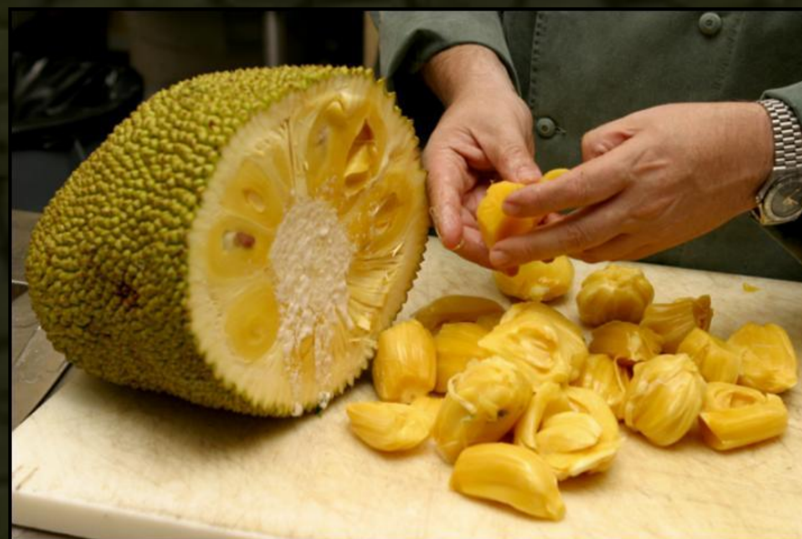
A sok szegmensből álló összetett termés pucolása kissé munkaigényes folyamat