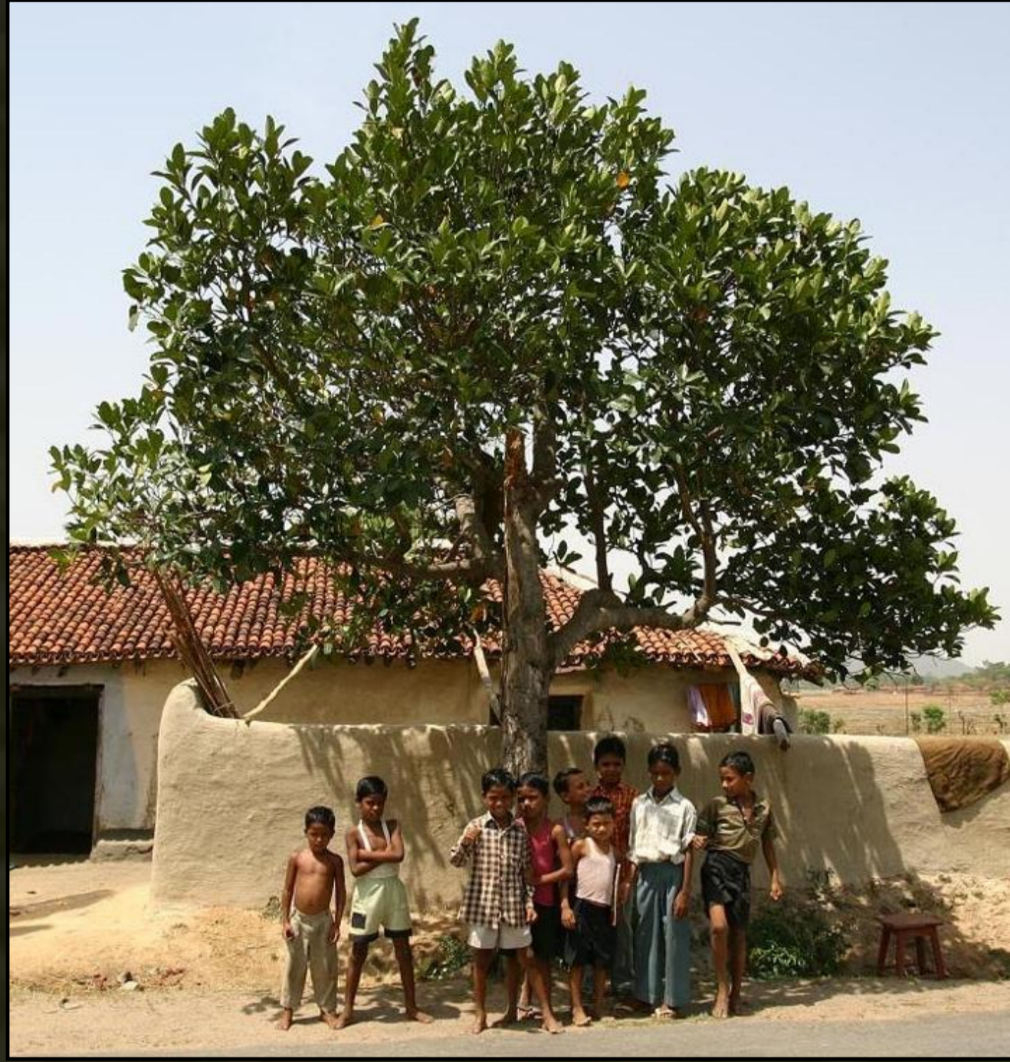
Jackfruit fa Indiában