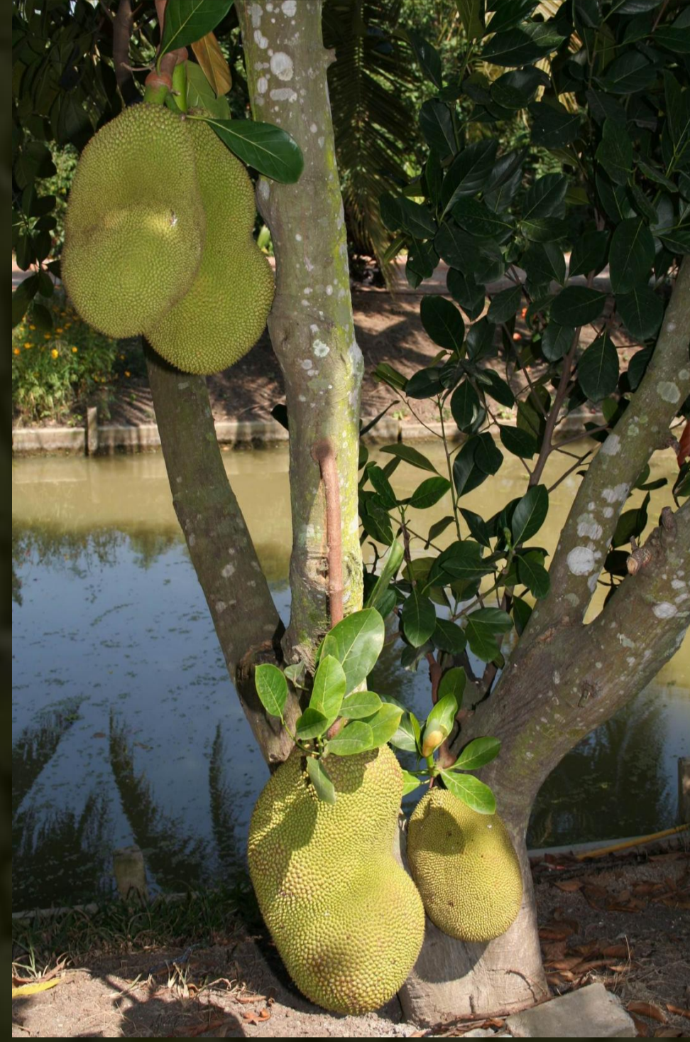
Fiatal fa termésekkel