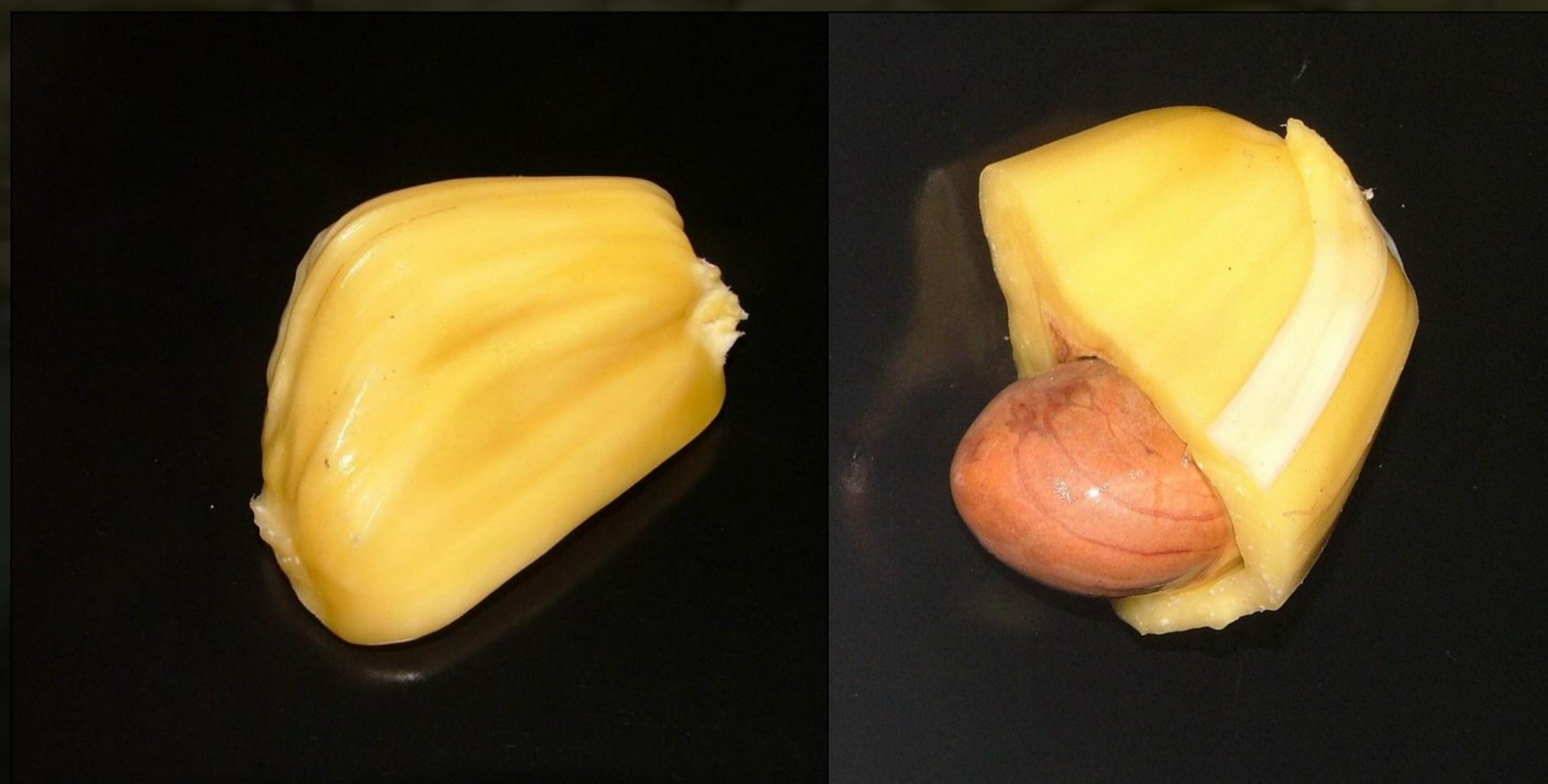
A termés szegmensei