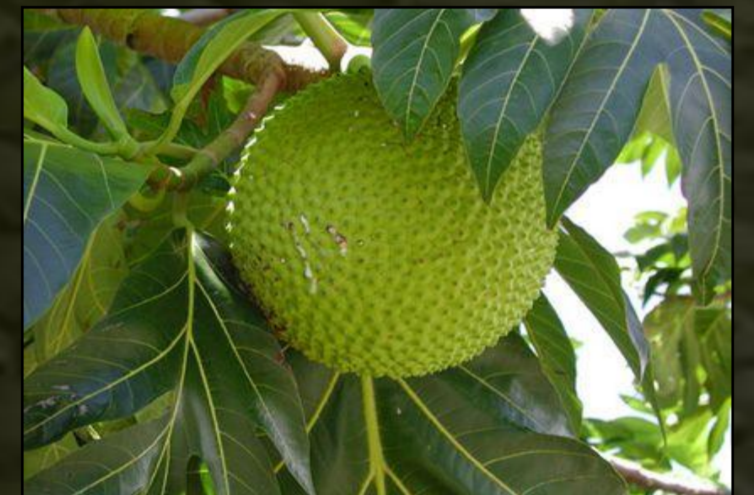
Rokon faj: kenyérfa ( Artocarpus altilis )