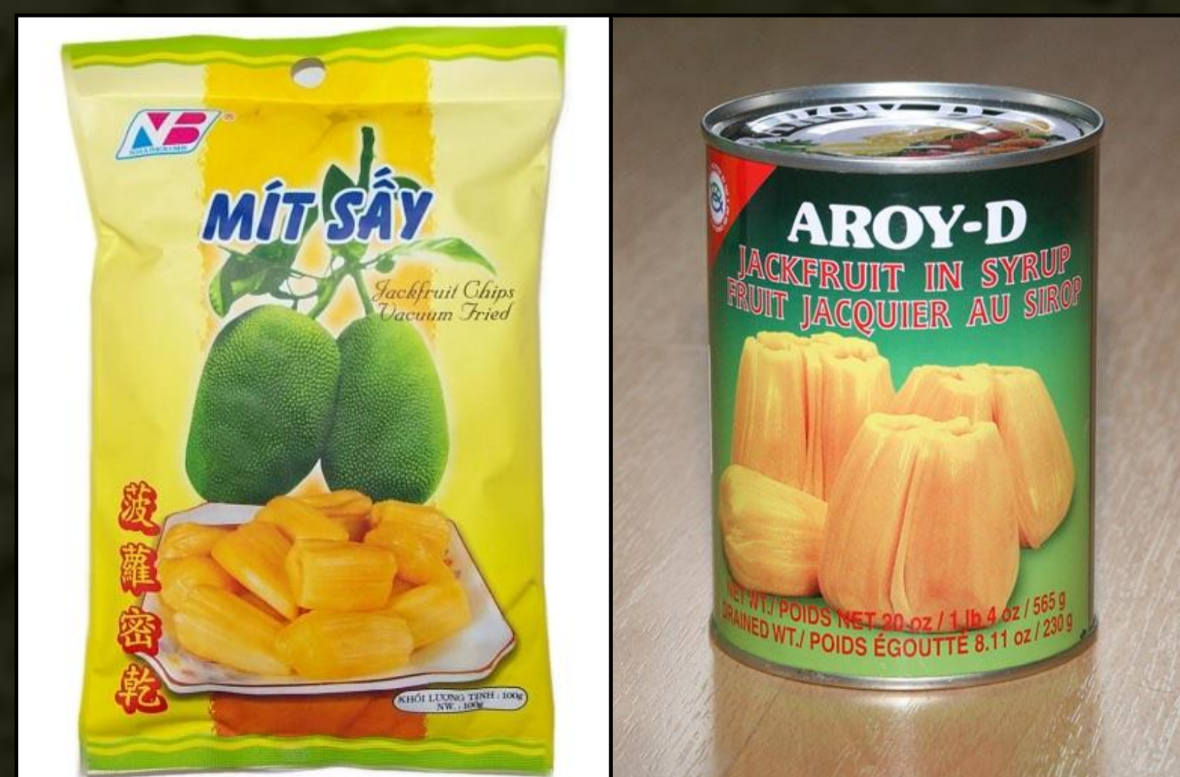
Feldolgozott formában is fogyasztják: jackfruit chips és konzerv