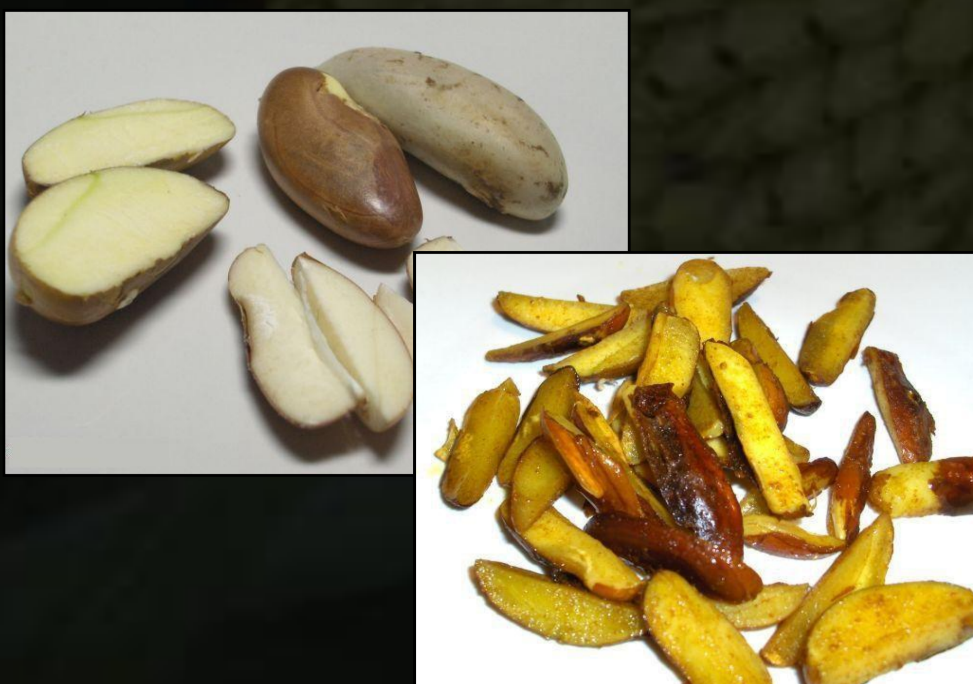
A magok is fogyaszthatók főzve, sütve akár curryvel is