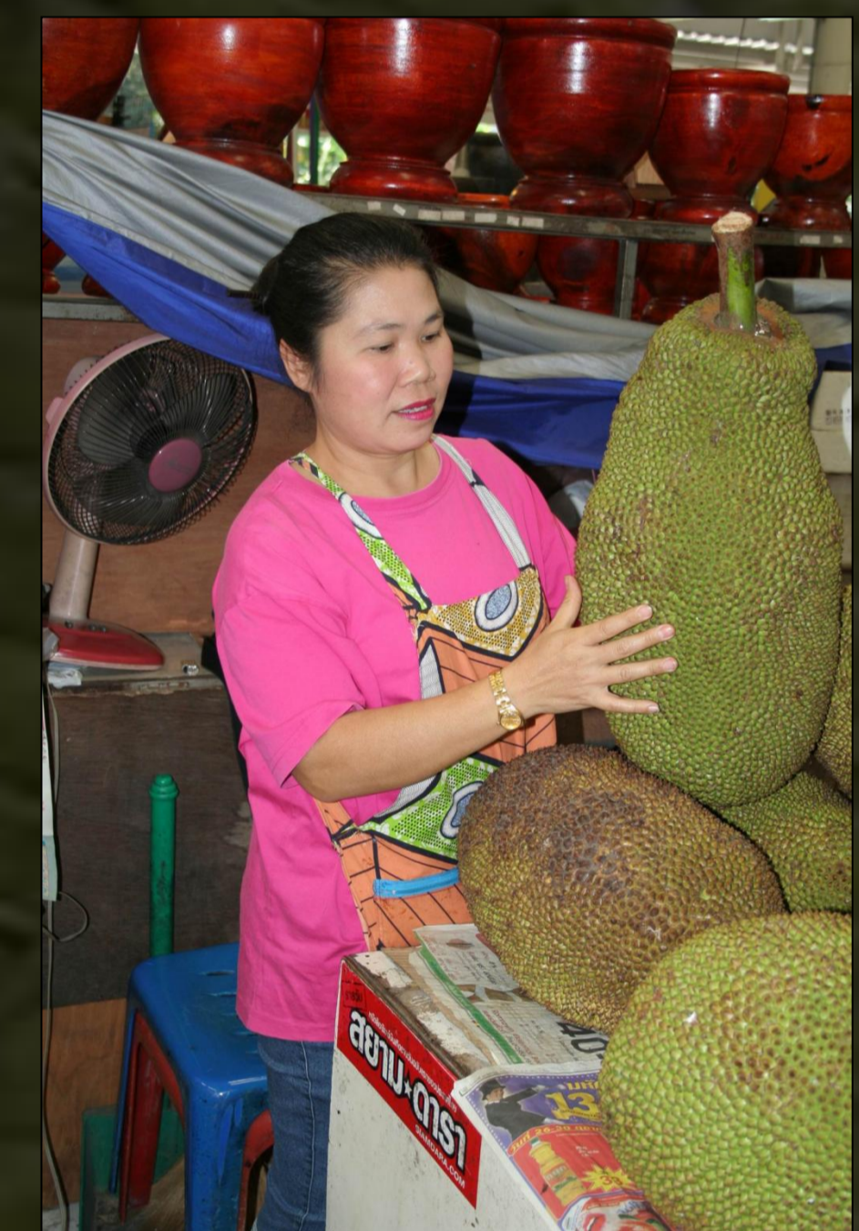
Jackfruit termések egy thaiföldi piacon