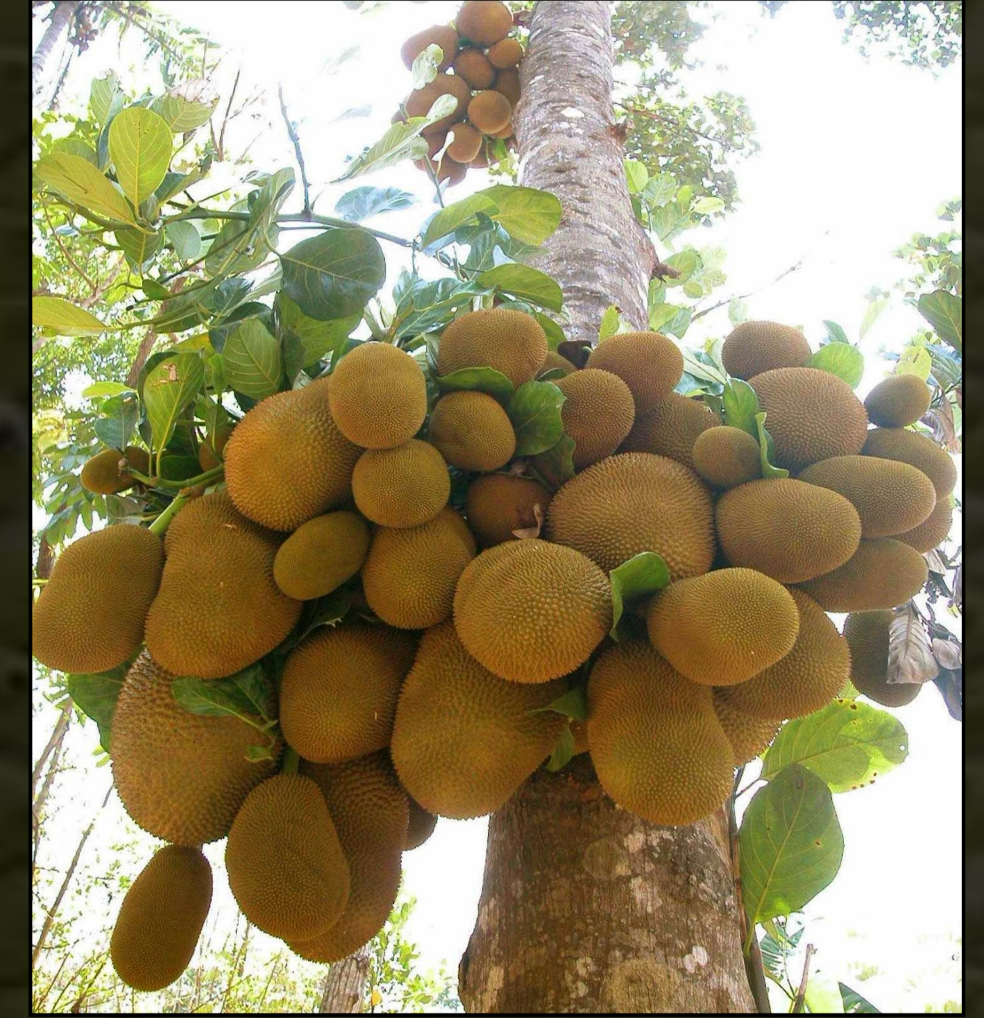
Idős fa termésekkel gazdagon berakódva